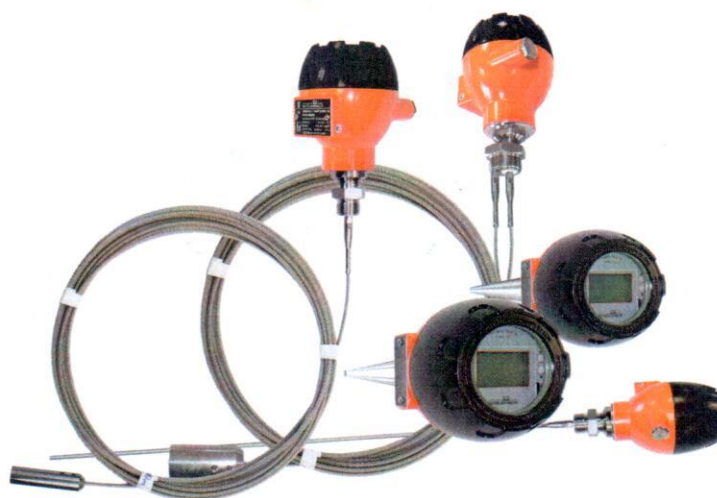
Рисунок 1 - Общий вид уровнемеров микроволновых Левелтач М

Общий вид уровнемеров микроволновых Левелтач М представлен на рисунке 1